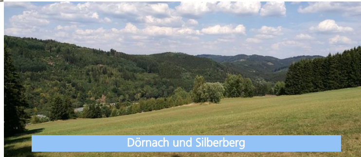
Dörnach und Silberberg

In Wallenfels bleibt Wohneigentum kein Traum. Mit einem Quadratmeterpreis von 40 Euro (vollerschlossen) ist Baugrund bei uns noch erschwinglich. Wer sich für eine Bestandsimmobilie entscheidet, kann im Stadtkern von Wallenfels nicht nur mit einer Förderung von bis zu 20.000 Euro für die Sanierung des Gebäudes rechnen, sondern profitiert auch noch von attraktivsten Abschreibungsmöglichkeiten.