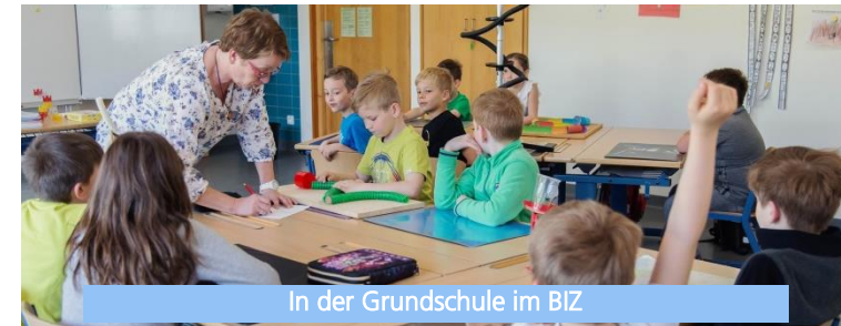
In der Grundschule im BIZ

Wallenfels bietet beste Voraussetzungen für die Vereinbarkeit von Familie und Beruf. Unser 2013 eröffnetes Bildungszentrum verfolgt ein einmaliges pädagogisches Konzept. Unter einem Dach sind Kinderkrippe und -garten, Grundschule, Kinderhort, Musikschule, Bücherei und VHS untergebracht. Alle Einrichtungen arbeiten eng zusammen und ermöglichen unseren Kindern spielerisches Lernen ohne Schwellenängste. In der Kreisstadt Kronach (15 km entfernt) gibt es alle weiterführenden Schulangebote.