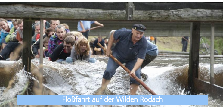
Flößfahrt auf der Wilden Rodach

Über die Stadtgrenzen hinaus sind wir für die Flößerei bekannt. Was früher hartes Handwerk war, mit dem unsere Vorfahren Geld verdienten, ist heute während der Sommermonate ein Riesenspaß für Tausende von Gästen.