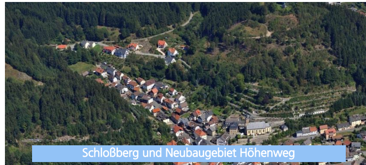
Schloßberg und Neubaugebiet Höhenweg

Der Landkreis Kronach ragt nicht nur geografisch aus Bayern heraus, er ist in vielerlei Hinsicht Spitze: So bietet die Region im Verhältnis zur Einwohnerzahl die höchste Zahl an Industriearbeitsplätzen in Bayern. Die Ansiedlung der Hochschule für Verwaltung in Kronach, das Angebot des Studiengangs Zukunftsdesign auf dem Loewe Campus und zukünftig weitere Hochschuleinrichtungen, geben der Region ein junges Gesicht.