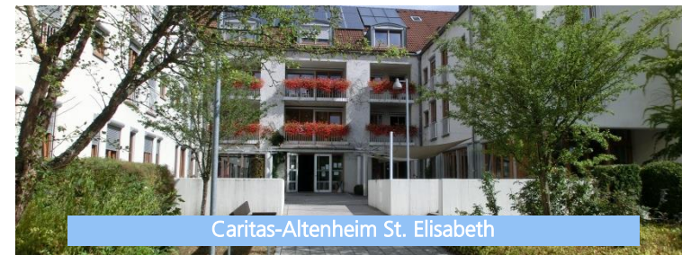
Caritas-Altenheim St. Elisabeth

Wallenfels bietet beste Voraussetzungen für die Vereinbarkeit von Familie und Beruf. Unser 2013 eröffnetes Bildungszentrum verfolgt ein einmaliges pädagogisches Konzept. Unter einem Dach sind Kinderkrippe und -garten, Grundschule, Kinderhort, Musikschule, Bücherei und VHS untergebracht. Alle Einrichtungen arbeiten eng zusammen und ermöglichen unseren Kindern spielerisches Lernen ohne Schwellenängste. In der Kreisstadt Kronach (15 km entfernt) gibt es alle weiterführenden Schulangebote.